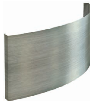
Panneau frontal décoratif