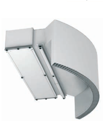
Fixé sur le dessus de la porte