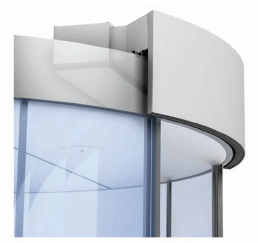
Montage au-dessus avec diffusion extérieure