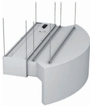
Suspendu par tiges filetées au plafond