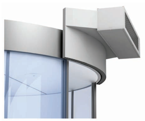
Montage encastré en faux-plafond avec diffusion extérieure